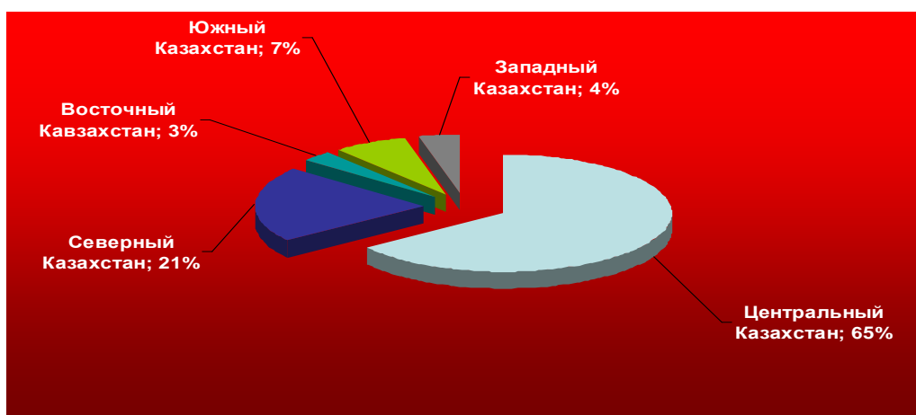
Размещение балансовых запасов угля Республики Казахстан по регионам

Все балансовые запасы коксующихся углей находятся на территории Карагандинской области.